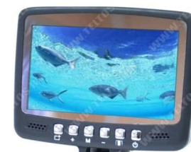
Fishcam plus 700