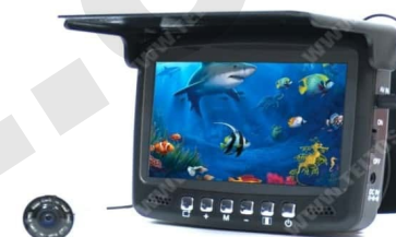
Fishcam plus 750