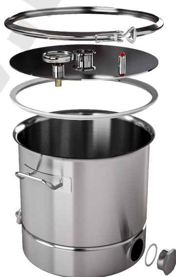
Рис. 2 — перегонный куб «СОЮЗ».Схема сборки

Также в комплектацию входят прокладки для кламповых соединений, прокладка под крышку. Аппарат имеет полностью съемную крышку с креплением под кламп. Крышка «СОЮЗ» крепится к перегонному кубу с помощью прижимного хомута (в случае комплектации кубом на зажимах, хомут не поставляется).