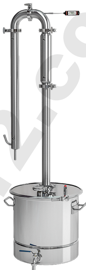
Рис. 7 — Режим укрепления и ректификации

Работа в данном режиме происходит следующим образом: