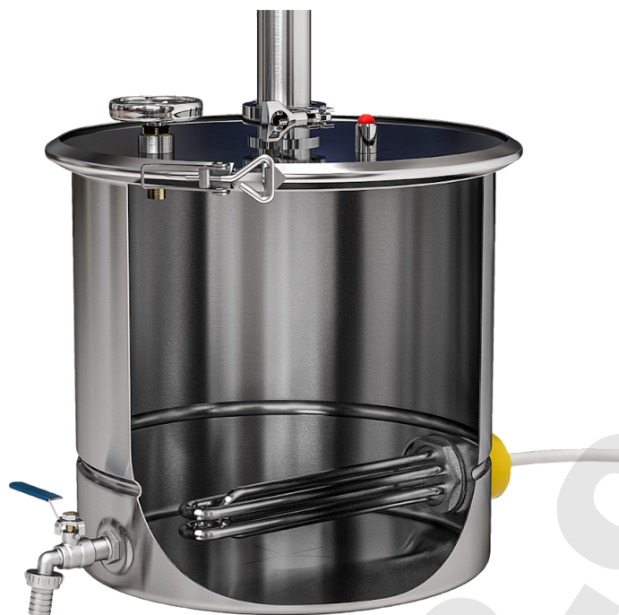
Рис. 4 — перегонный куб «СОЮЗ» с установленным ТЭН

В данном руководстве рассмотрены основные режимы работы оборудования.