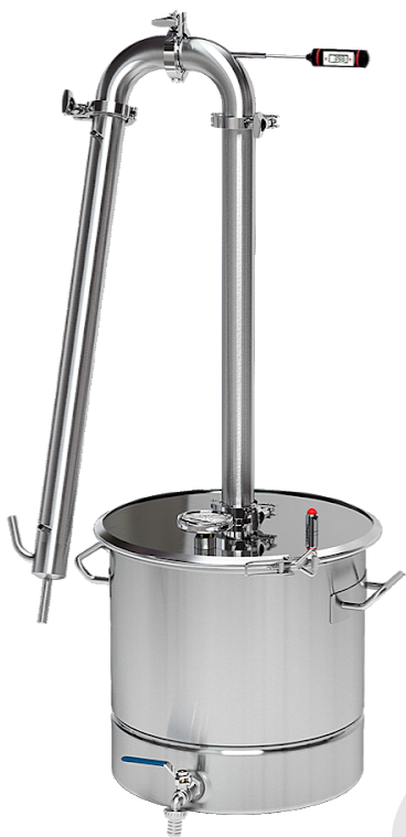
Рис. 6 — Режим дистилляции