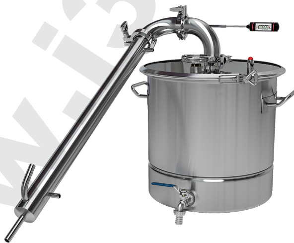
Рис. 5 — Сборка системы в режиме Pot-still

Работа в данном режиме происходит следующим образом: