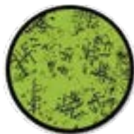
Рис.2 Переходный период