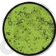
Рис.1 Неблагоприятный период

• - определить наличие беременности по отсутствию "папоротниковой" структуры в те дни цикла, когда она обычно начинает появляться. При этом постоянно наблюдается структура, показанная на рис.3.