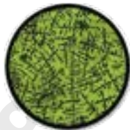
Рис.3 Благоприятный период