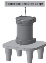
Защитная решётка вверх